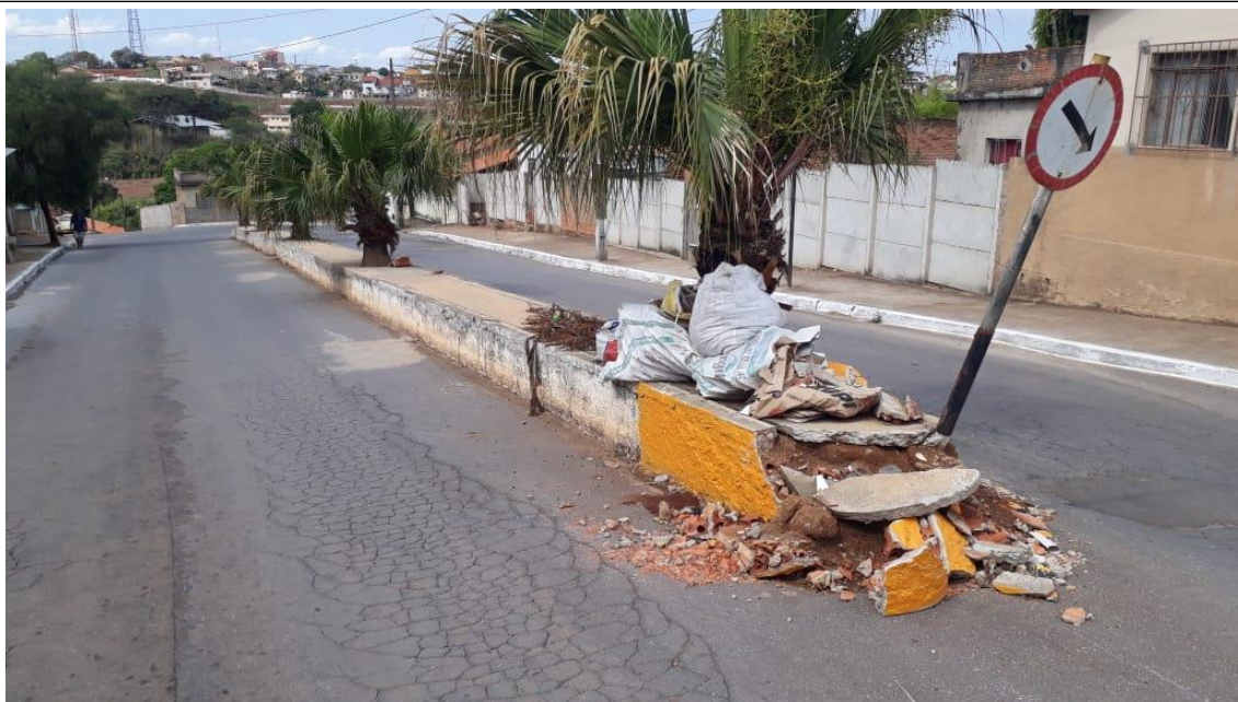
Exemplo dos tachões separando as mãos de direção.